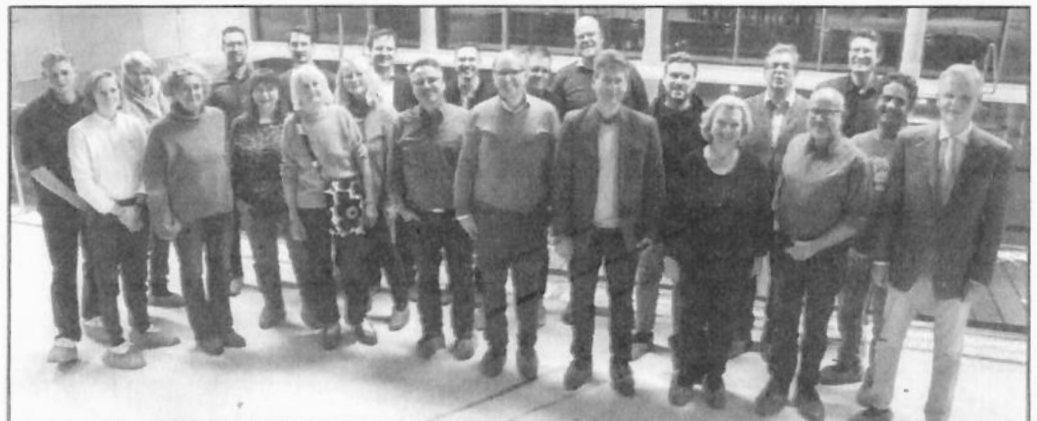
Gemeinderäte, Projektbeteiligte und Mitarbeiter der Verwaltung freuen sich über die zusätzliche Sportmög- lichkeit.