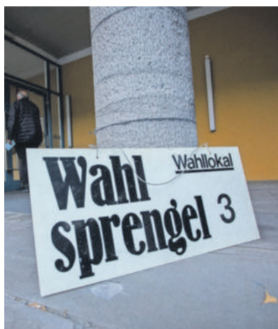
Die Landtagswahl 2024 rückt näher. Sechs Wochen sind es noch.

BREGENZ Die Landeswahlbehörde hat am Dienstag den Stimmzettel für die Landtagswahl am 13. Oktober beschlossen. Sie bestätigte die neun Parteien, die einen Wahlvorschlag eingereicht haben, und zwar in dieser Reihenfolge: ÖVP, Grüne, FPÖ, SPÖ, Neos, WIR, Xi - HaK - Gilt, KPÖ und Andrs. Alle Parteien kandidieren in allen Wahlbezirken sowie mit einer Landesliste für das zweite Ermittlungsverfahren. Nähere Auskünfte erteilt das Land unter inneres@vorarlberg.at.