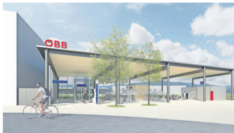
So soll die neue Haltestelle in Wolfurt nach der Fertigstellung 2026 aussehen. Komnende Woche beginnen die Hauptbauarbeiten. ÖBB

WOLFURT Am Montag (9. September) legen die ÖBB mit den Hauptbauarbeiten am Bahnhof Wolfurt los. Um rund 49,5 Millionen Euro werden die Bahnsteige verlängert und erhöht, neue Park&Ride-Anlagen gebaut, die Bike&Ride-Anlagen erweitert und die Vorplätze neu gestaltet. Außerdem wird die Unterführung modernisiert und um drei Aufzüge ergänzt. Aufgrund der Arbeiten fällt bis 13. Dezember tagsüber jede zweite S-Bahn zwischen Dornbirn und Bregenz-Hafen aus.